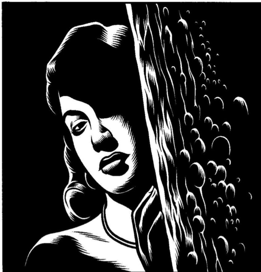
Black Hole, Charles Burns

Hier gebruiken we een twist die vaak in horrorfilms gebruikt wordt: het terugkeren naar de plek van het drama of de moord. Na de maaltijd besluiten de trainers koers te zetten naar hun vroegere werkplaats en hun aller obsessie. Dit einde waar het begin zich in weerspiegelt kan ook een metafoor zijn van wezens die maar steeds terugkeren naar een plek die, vervuld van hun verloren ambities, nu geen enkel nut meer heeft.